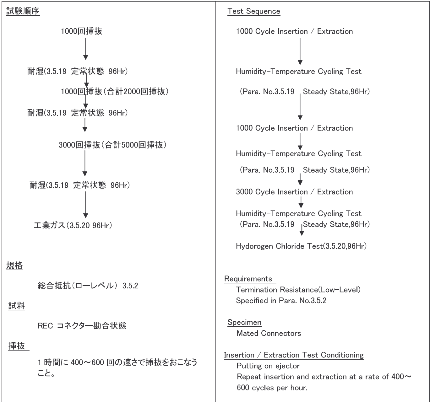
Fig.3 挿抜耐久性(オフィス外環境 5000 回) Fig.3 Durability Test (Harsh Environment)