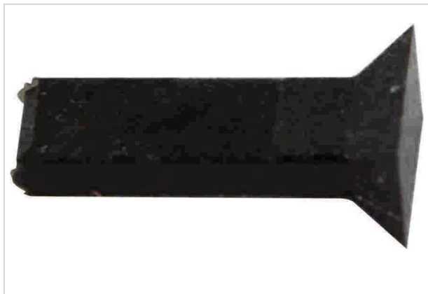
Imagem somente para efeito ilustrativo. Por favor, consulte a descrição do produto.